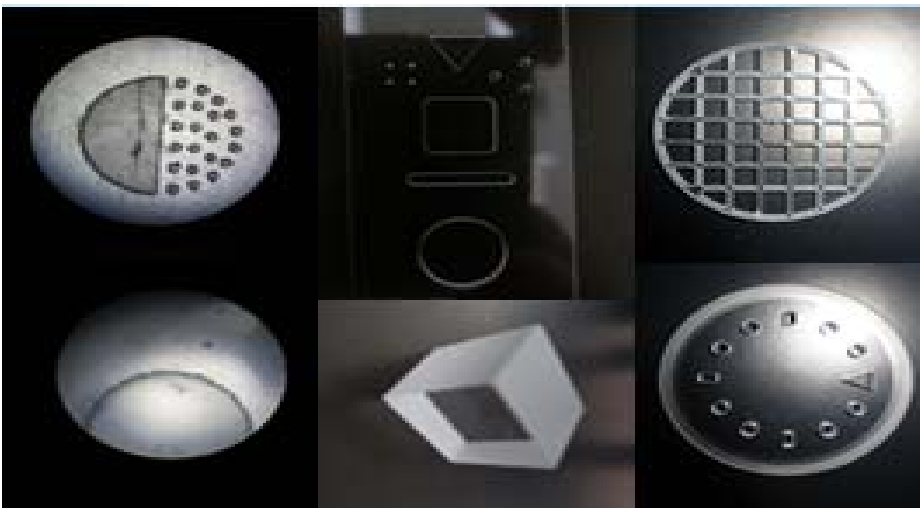
脆性玻璃材料内雕加工及切割