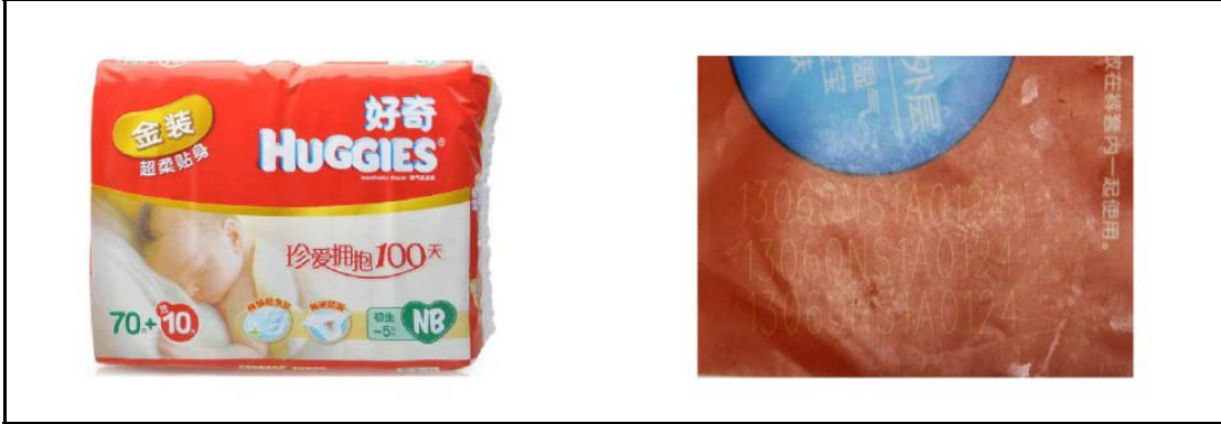
卫生用品包装打标