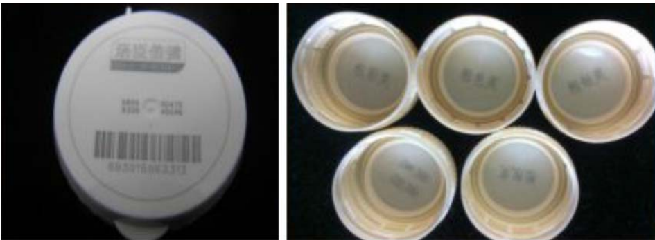
塑料瓶盖飞行标刻