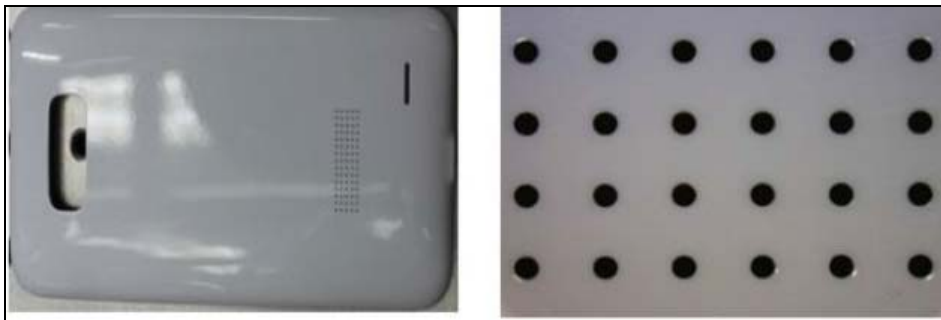
手机背板听筒钻孔